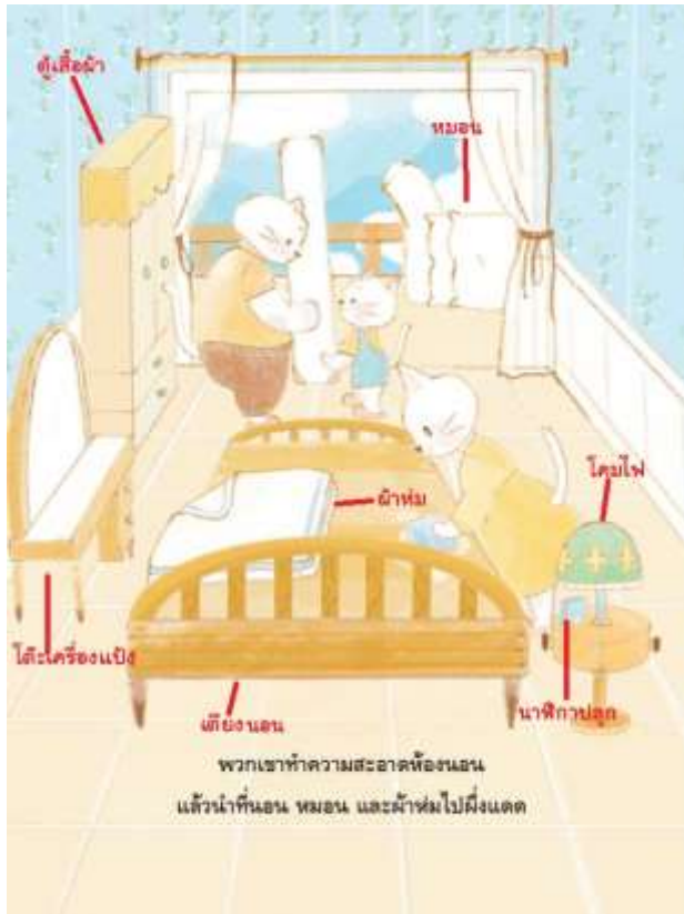
5.6 จากนั้นให้เด็กสังเกตภาพในหน้า 4 อีกครั้งเพื่อมองหาว่า หมอน นาฬิกาปลุก โต๊ะเครื่องแป้ง ผ้าห่ม โคมไฟ ตู้เสื้อผ้า เบาะนอน อยู่ตรงส่วนใดของภาพ