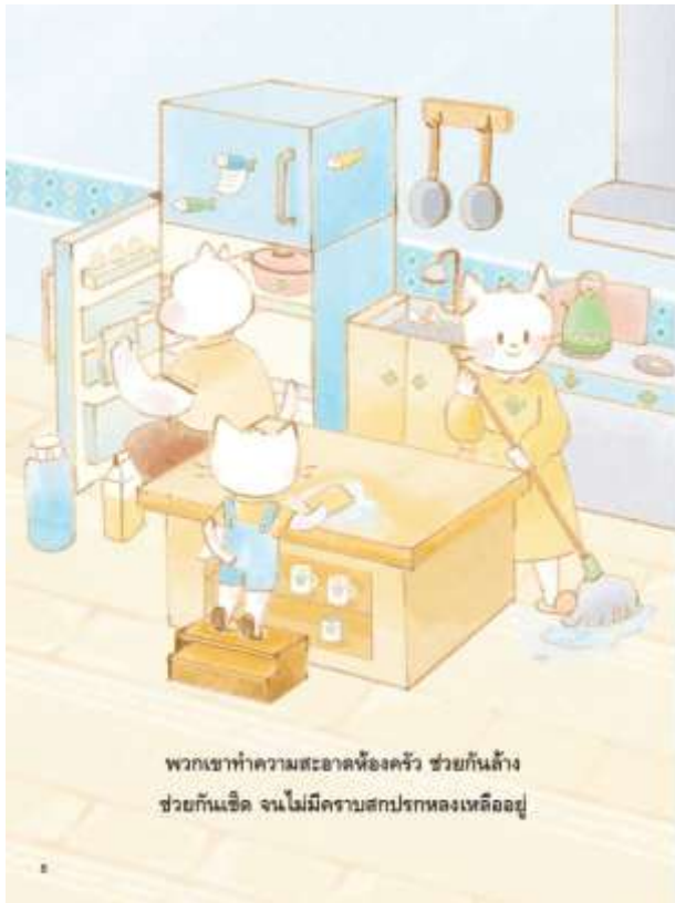
5.10 “พวกเขาทำความสะอาดห้องครัว ช่วยกันล้าง ช่วยกันเช็ด จนไม่มีคราบสกปรกหลงเหลืออยู่” ครูให้เด็กสังเกตภาพในหน้า 8 อย่างละเอียด ถามเด็กว่า พ่อแม่ว แม่แม่ว และลูกแม่ว กำลังทำอะไร