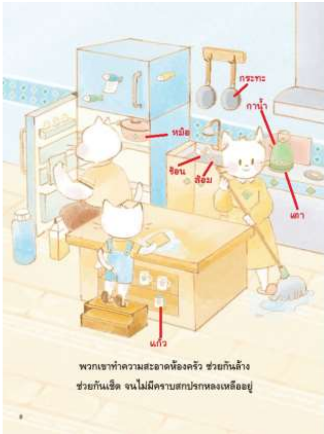
5.12 จากนั้นให้เด็กสังเกตภาพในหน้า 8 อีกครั้งเพื่อมองหาว่า กาน้ำ ช้อน ส้อม หม้อ กระทะ แก้วน้ำ เต้า อยู่ตรงส่วนใดของภาพ