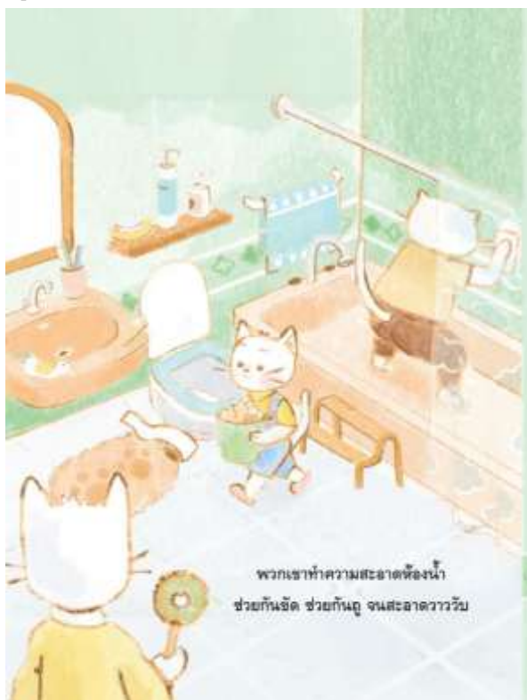
5.7 พวกเราทำความสะอาดห้องน้ำ ช่วยกันขัด ช่วยกันถู จนสะอาดวาววับ” ครูให้เด็กสังเกตภาพในหน้า 6 อย่างละเอียด ตามเด็กว่า พ่อแม่ว แม่แม่ว และลูกแม่ว กำลังทำอะไร