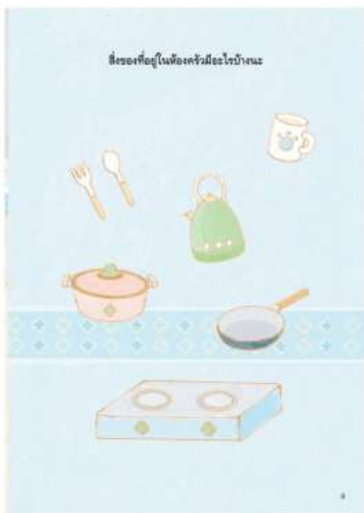
5.11 เมื่อเด็กตอบครบทุกคนแล้ว ให้ชี้ไปที่หน้า 9 แล้วเล่านิทานต่อไปว่า “สิ่งของที่อยู่ในห้องครัวมีอะไรบ้างนะ” ให้เด็กดูภาพในหน้า 9 ชี้และบอกชื่อสิ่งของที่อยู่ในห้องครัวที่ละภาพ (กาน้ำ ช้อน ส้อม หม้อ กระทะ แก้วน้ำ เต้า)