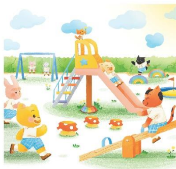
เราเล่นสนามเด็กเล่น ก็คุยพร้อมๆ

6.5 ครูให้เด็กสังเกตภาพในหน้า 11 แล้วให้เด็กบอกชื่อเครื่องเล่นสนามในภาพ