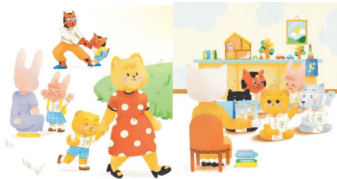
ไปโรงเรียน ด้วยความแง้งใจ ก็คุยซู่ใจ ไม่ทำหน้ามู๋

6.4 ครูให้เด็กสังเกตภาพในหน้า 8 และ 9 แล้วให้เด็กบอกผลที่จะเกิดขึ้นจากสิ่งที่ลูกกระต่ายและลูกแมวทำ