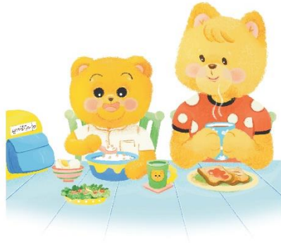
แล้วกินอาหาร นิ่งเสียวตุ้ย ๆ

6.3 ครูให้เด็กสังเกตภาพในหน้า 7 แล้วให้เด็กบอกชื่ออาหารที่เห็น