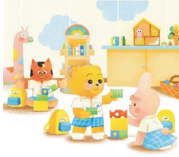
กิมแสร้งเป็นบ้าน ขอแม่มาช่วยกันบ้าน ปูกูปลูกโยนกันมั่วๆ

6.6 ครูให้เด็กสังเกตภาพในหน้า 13 แล้วให้เด็กแสดงความคิดเห็นเกี่ยวกับการเล่นบล็อกไม้ในภาพ